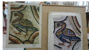
Curs de mosaics