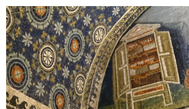
Grup A - Núm. G.C. 2283