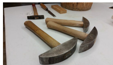
Eines del curs

Grup mínim 5 persones. Condicions generals i especials segons normes autonòmiques vigents en el lloc de celebració del contracte de viatge combinat i en el seu defecte, segons el R. Decret Legislatiu 1/2007 de 16 de novembre de la llei estat, per la defensa del consumidor i usuari. Les podeu consultar a la nostra web: domustravel.com