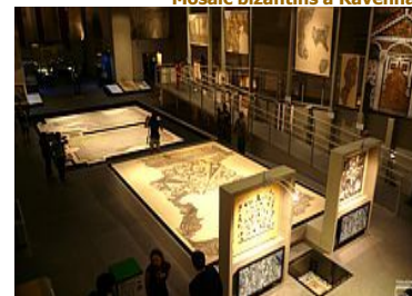
Museu dels mosaics a Ravenna