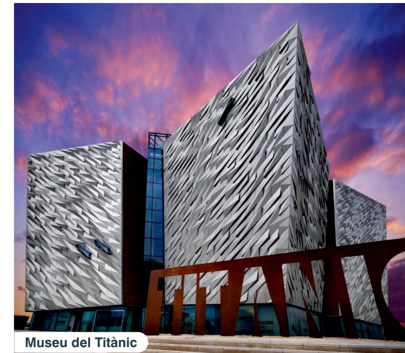
Museu del Titànic