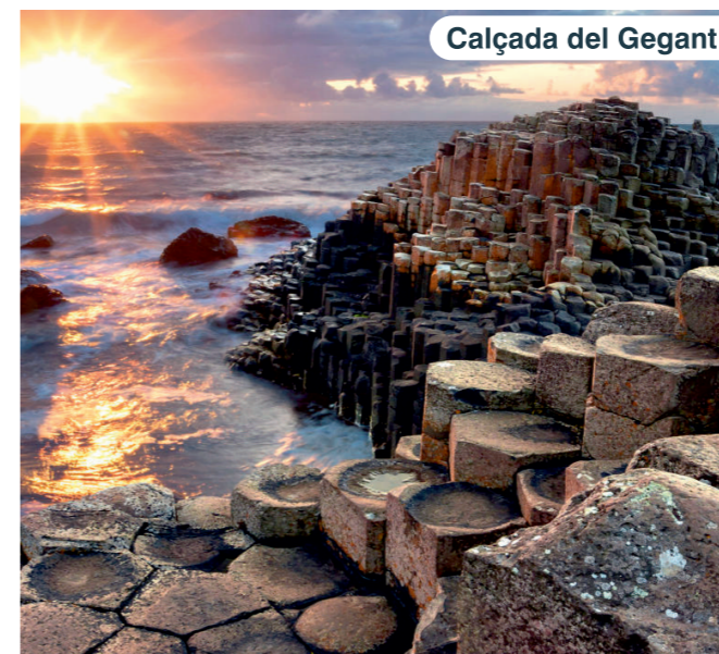
Calçada del Gegant

Sortida cap a Derry i recorregut a peu pel centre històric, rodejat de intactes muralles originals. Farem una breu parada als afores del Castell de Dunluce i arribarem a la Calçada del Gegant, una espectacular formació natural de columnes prismàtiques de basalt. A la tarda sortida cap a Belfast.