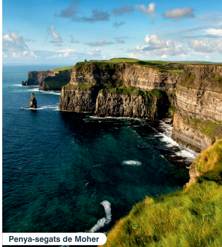
Penya-segats de Moher

Visita al castell de Bunratty i el seu parc folklòric, una poderosa fortalesa normanda que compren una vasta propietat i un museu a l'aire lliure que il·lustra la vida tradicional irlandesa. Sortida cap a la regió del Burren, una formació geològica molt particular, amb el paisatges lunars que amaguen in comptables tresors arqueològics, botànics i zoològics. Continuarem visitant els penya-segats de Moher, on podrem caminar sobre els acantilats més famosos d'Irlanda. A la tarda sortida cap al comptat de Galway