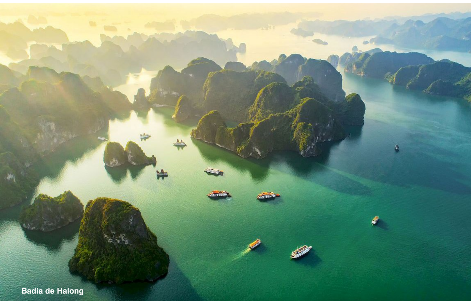
Badia de Halong

HO CHI MING - MEKONG - HUE - HOI AN DANANG - SIEM REAP - HANOI - BADIA DE HALONG