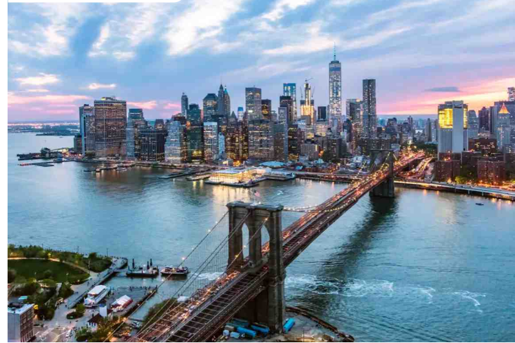
Pont de Brooklyn

Recorrerem 3 dels 5 barris de la ciutat. El famós barri del Bronx, passant per l'estadi dels Yankees, escales de Joker, sector conegut com a "Fort Apache" i àrea del Precinte 42. Observarem els graffitis més representatius de la zona i passarem per Queens, amb els seus clàssics barris residencials com Malba i Jackson Heights. Finalment arribarem a Brooklyn on quedarem impressionats amb el fascinant barri jueu. Passarem pel pont de Brooklyn a Dumbo. Tornada a l'hotel.