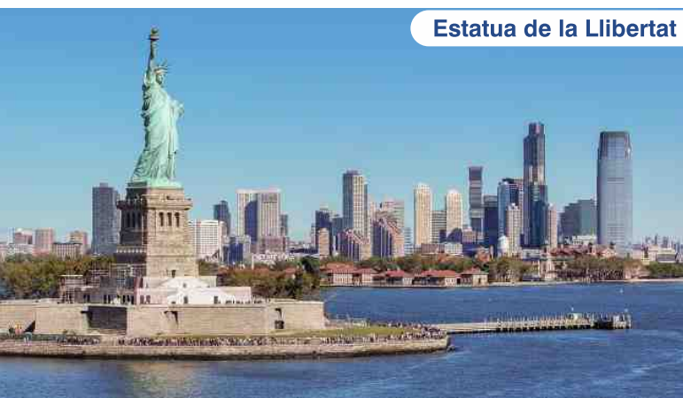
Estàtua de la Llibertat