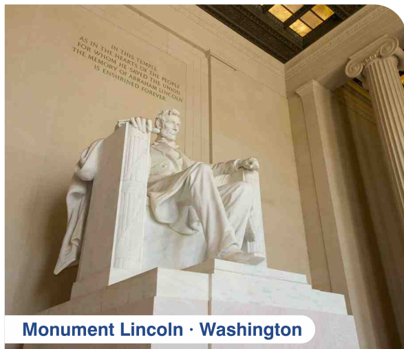
Monument Lincoln · Washington